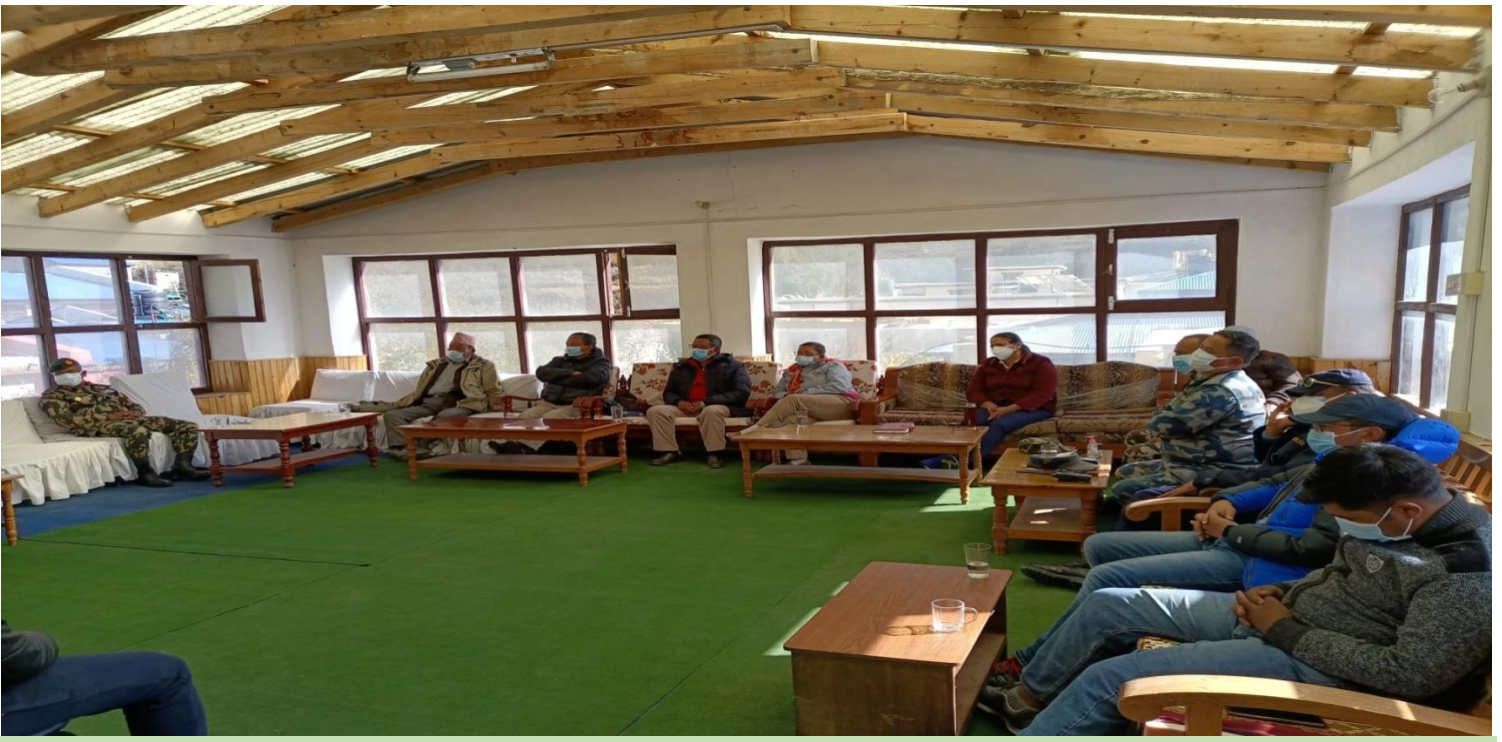
प्रमुख जिल्ला अधिकारीको अध्यक्षतामा कोभिड-१९ संकट व्यवस्थापन केन्द्रको बैठक बस्दै