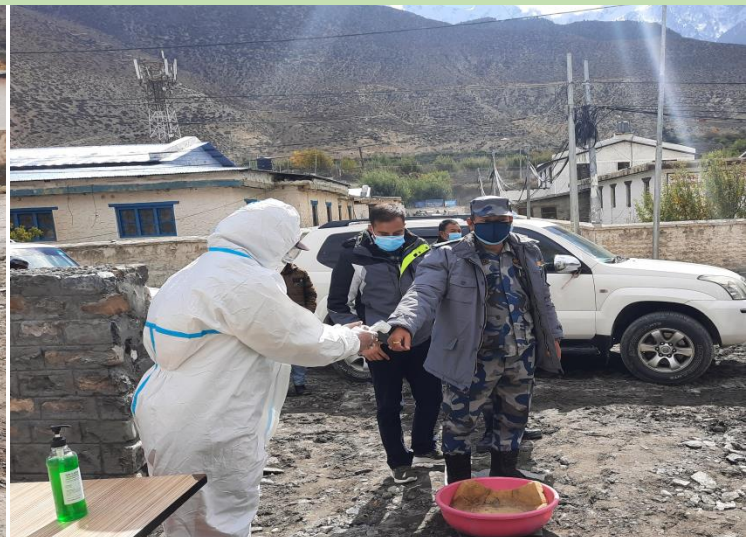
श्रीमान स.प्र.म.नि. र स.प्र.अ.म.नि.ज्यू समेतको टोलीको कोभिड-१९ सुरक्षार्थ निर्मलीकरण गरीदै