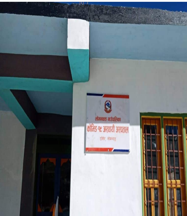
कोभिड-१९ अस्थायी अस्पताल, लोमन्थाङ गा.पा., छोसेर

कोभिड १९ को रोकथाम र नियन्त्रणकालागि चालिएका क्रियाकलापहरूको समिक्षा गर्दा हालको जिल्लाको अवस्था सामान्य रहेको ।