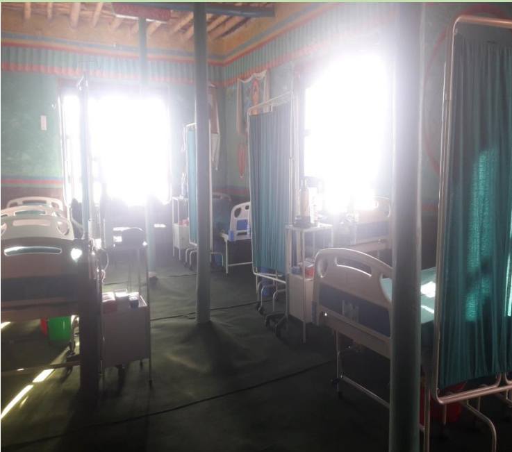
कोभिड-१९ अस्थायी अस्पताल, लोधेकर दामोदरकण्ड-१, चराङ