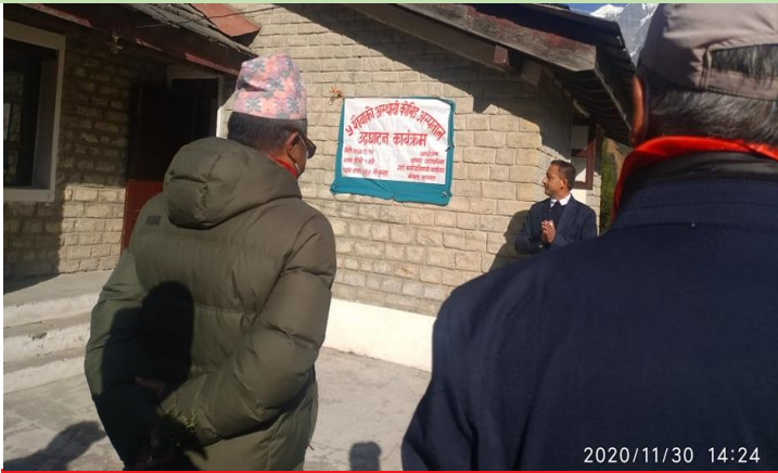
साबुन पानीले हात धोऔं । रोग र किटाणुबाट बचौं ।