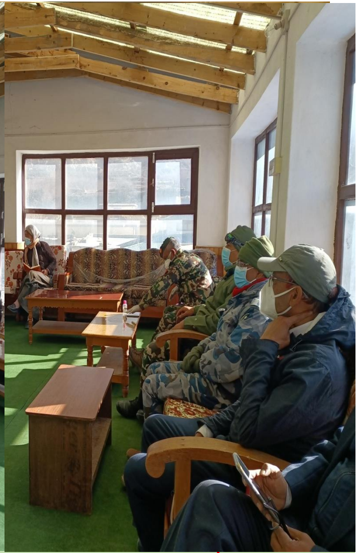
प्रमुख जिल्ला अधिकारीको अध्यक्षतामा कोभिड-१९ संकट व्यवस्थापन केन्द्रको बैठकको तस्बिर