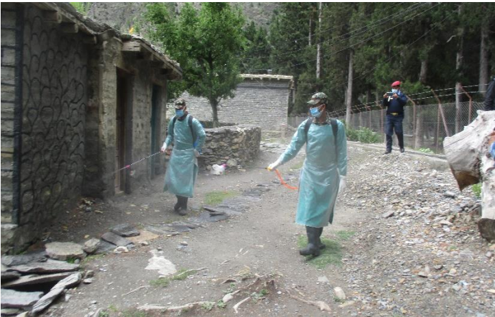
घरपझोड गाउँपालिका वडा नं. १ छैरो स्थित तिब्बतीयन क्याम्पमा Disinfection गर्दै सुरक्षाकर्मी ।