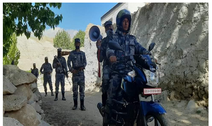
कोभिड १९ सम्बन्धि माईकिड्द्वारा जनचेतना फैलाउँदै सुरक्षाकर्मीहरु