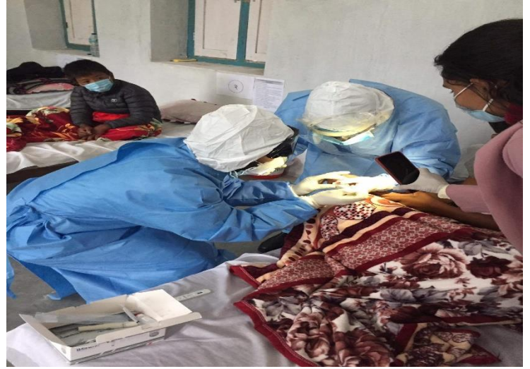
कोभिड-१९ सम्बन्धी स्वास्थ्य परिक्षण गर्दै स्वास्थ्यकर्मीहरू ।

मिति २०७७/०४/३२ गतेसम्म मुस्ताङ जिल्लामा चारवटा हेल्थ डेस्क र जिल्ला अस्पतालमा स्थापना गरिएको फिभर क्लिनिकबाट १३८८२ जनाको स्वास्थ्य परिक्षण गरिएको छ ।