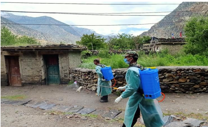
सार्वजनिक स्थलहरुमा Disinfection को कार्य गर्दै सुरक्षाकर्मीहरु ।

नोट : उल्लेखित RDT परिक्षणहरु सम्पन्न गर्दा जम्मा १५५ (एक सय पचपन्न) जनाको पुनः परिक्षण गर्नु परेको हुँदा हालसम्म जम्मा १२७८ जना व्यक्तिहरुको RDT परिक्षण गर्दा १४३३ (एक हजार चार सय तेत्तिस) वटा RDT किट प्रयोग भएको ।