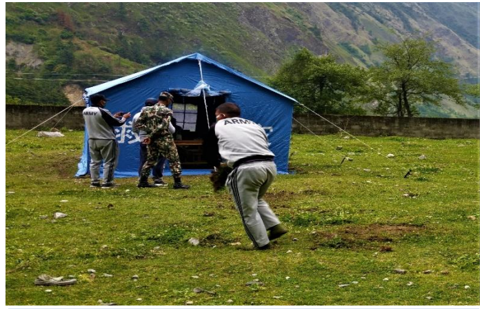
घाँसास्थित RDT क्लिनिकलाई व्यवस्थित गर्दै सुरक्षाकर्मी