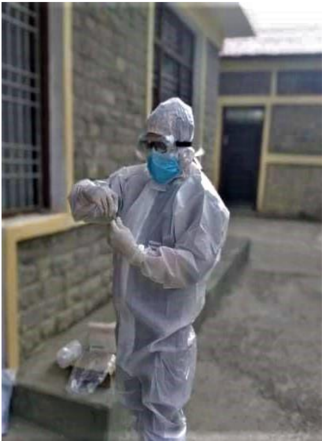
सुरक्षित रुपमा स्वाव संकलन गर्दै मुस्ताङ्ग जिल्ला अस्पताल जोमसोमका स्वास्थ्यकर्मी