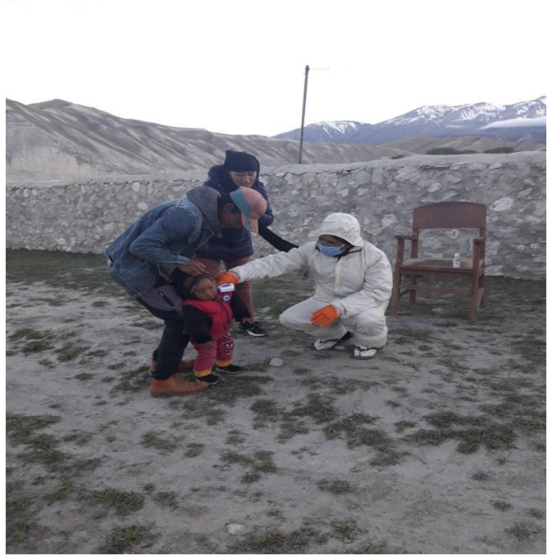
उपल्लो मुस्ताङमा स्थानियको फिभर चेक गर्दै स्वास्थ्यकर्मी