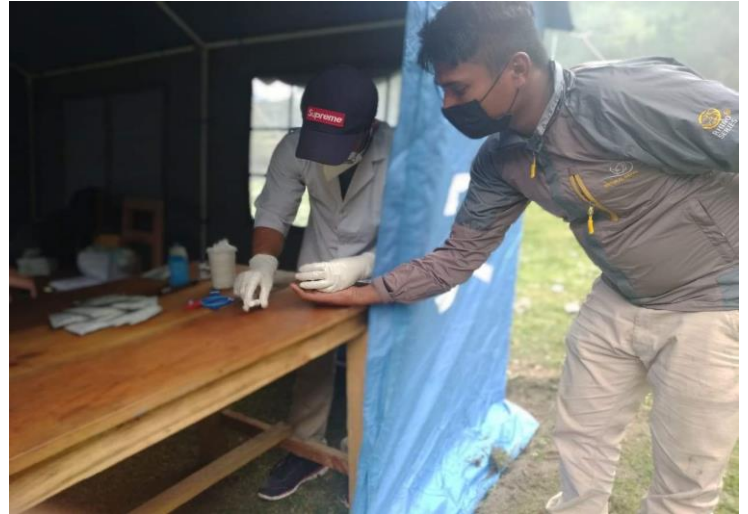
घाँसास्थित RDT क्लिनिकमा RDT चेकजाँच गर्दै जिल्ला अस्पताल जोमसोमका स्वास्थ्यकर्मीहरू ।

मिति २०७७/०३/३१ गतेसम्म मुस्ताङ जिल्लामा चारवटा हेल्थ डेस्क र जिल्ला अस्पतालमा स्थापना गरिएको फिभर क्लिनिकबाट १३५११ जनाको स्वास्थ्य परिक्षण गरिएको छ ।