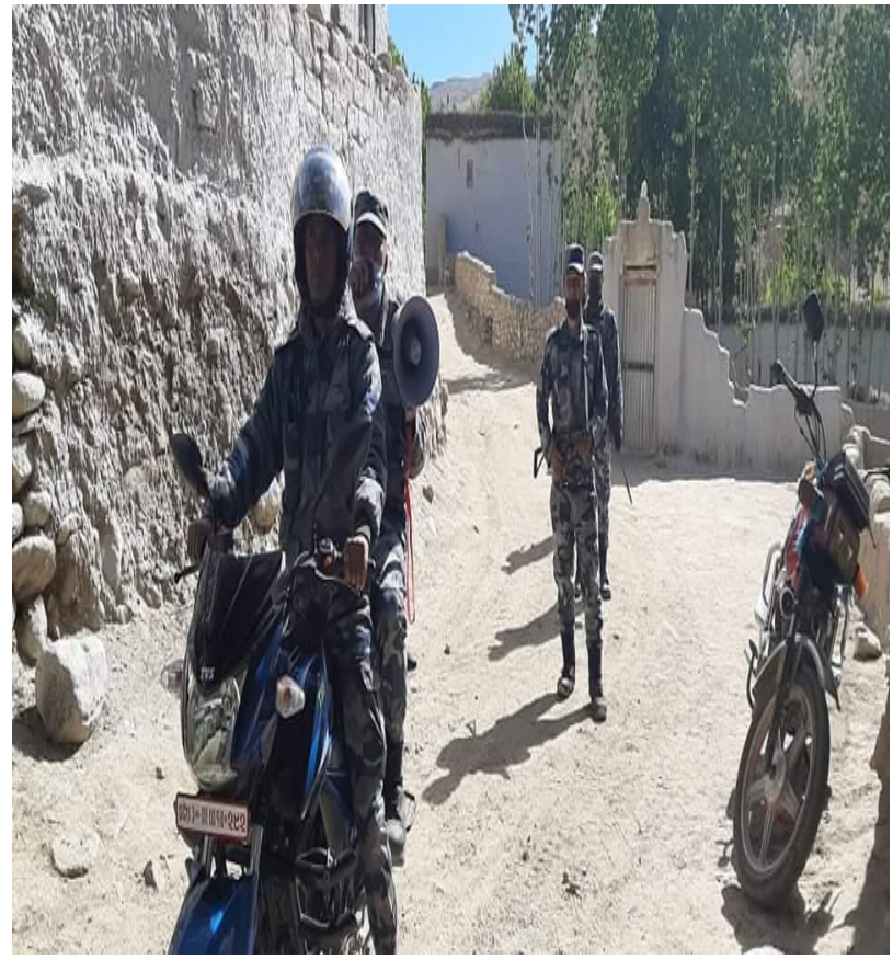
कोभिड १९ सम्बन्धि माईकिङ्गद्वारा जनचेतना फैलाउँदै सुरक्षाकर्मीहरु