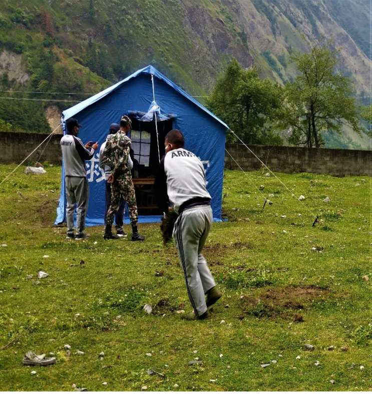
घाँसास्थित RDT क्लिनिकलाई व्यवस्थित गर्दै सुरक्षाकर्मी