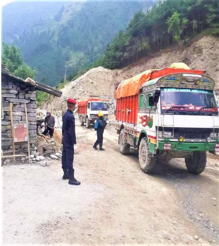
घाँसा नाकाबाट मुस्ताङ जिल्ला प्रवेश गर्ने सवारी साधनहरूलाई Disinfection गर्दै सुरक्षाकर्मीहरू