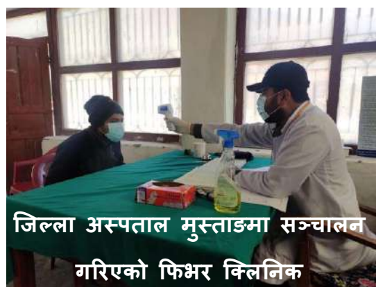
जिल्ला अस्पताल मुस्ताङमा सञ्चालन गरिएको फिभर क्लिनिक

मुस्ताङ जिल्ला स्थित विभिन्न स्थानमा रहेका विदेशबाट आएका ३४ जना व्यक्तीहरुको आर.डि.टी. गरिएको छ । यसरी परिक्षण गरिएका मध्य हाल सम्म ३४ सै जनाको रिपोर्ट Non-Reactive आएको छ । अन्य व्यक्तीहरुको पनि पहिचान गरी आर.डि.टी. गर्ने योजना रहेको छ ।