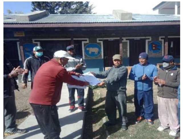
पुथाङ स्थित समाजघरमा रहेको क्वारेन्टाईन अनुगमन