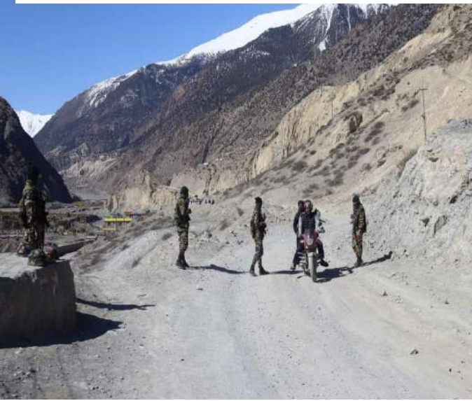
नेपाली सेनाद्वारा चेकप्वाइन्ट डियुटी

मुस्ताङ जिल्लामा हालको विद्यमान परिस्थितिमा कालो बजारी हुन नदिन नियमित रूपमा बजार अनुगमन भईरहेको छ । यस जिल्लामा दैनिक उपभोग्य वस्तुहरूको अभाव हुन नदिन समयमा नै सवारी अनुमति पत्र जारी गरी दैनिक उपभोग्य वस्तुहरूको आयात गर्ने व्यवस्था मिलाइएको छ ।