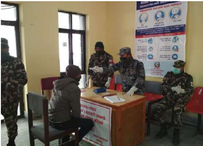
पुथाङ्ग एयरपोर्ट स्थित हेल्थ डेस्क