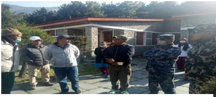
लेते स्थित प्राथमिक उपचार केन्द्रमा स्थापना गरिएको आईसोलेसन कक्षको अनुगमन