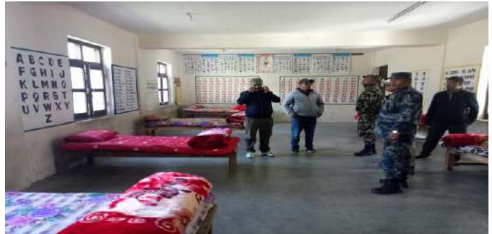
कोवाङ्ग स्थित क्वारेन्टाईन कक्षको अनुगमन