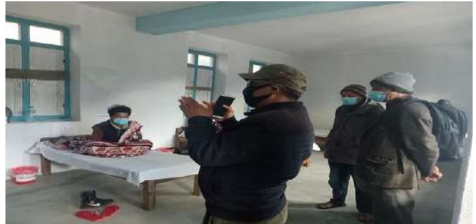
घाँसा स्थित क्वारेन्टाईन कक्षको अनुगमन