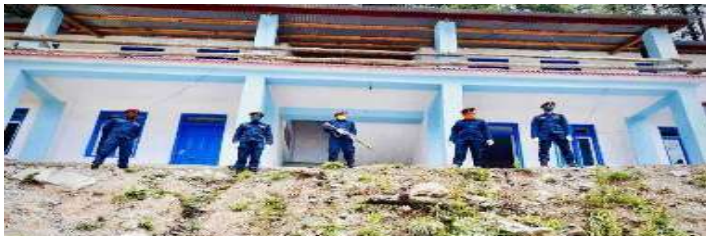
थासाङ्ग गाउँपालिका स्थित जनता मा.वि. मा स्थापना गरिएको Quarantine कक्षको सुरक्षा गर्दै सुरक्षाकर्मीहरू