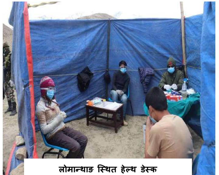
लोमान्थाङ्ग स्थित हेल्थ डेस्क