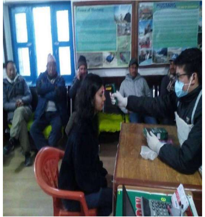
घाँसा स्थित हेल्थ डेस्क