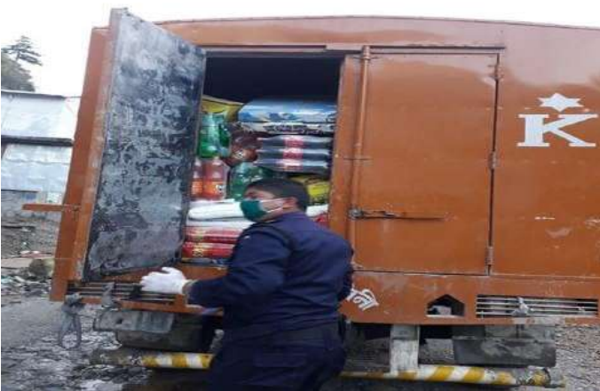
नेपाल प्रहरीद्वारा सवारी चेकजाँच

विश्वभरी महामारीको रूपमा फैलिदै गएको कोरोना भाईरस (COVID-19) लाई मध्यनजर गरी नेपाली सेना, नेपाल प्रहरी, सशस्त्र प्रहरी बल, नेपालद्वारा नियमित रूपमा पट्रोलहरू संचालन गर्ने गरेको छ ।