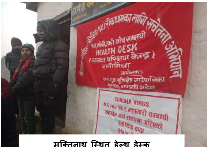
मुक्तिनाथ स्थित हेल्थ डेस्क