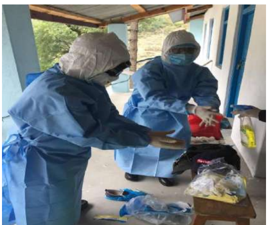
RD Test गर्दै जिल्ला अस्पतालका चिकित्सकहरु