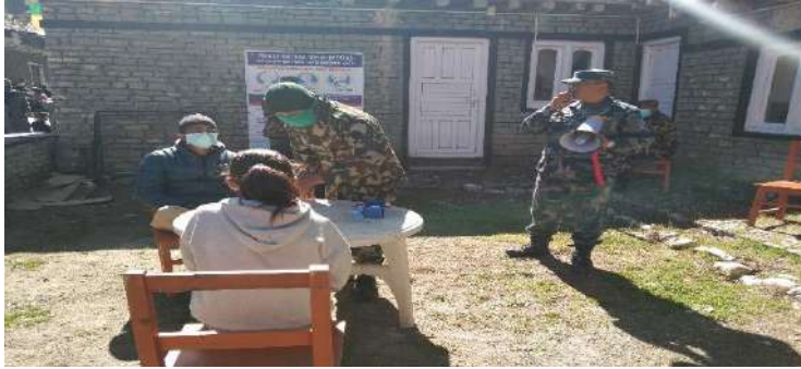
छैरो तिब्बतियन शरणार्थी क्याम्पमा स्वास्थ्य चेकजाँच एवं अनुगमन