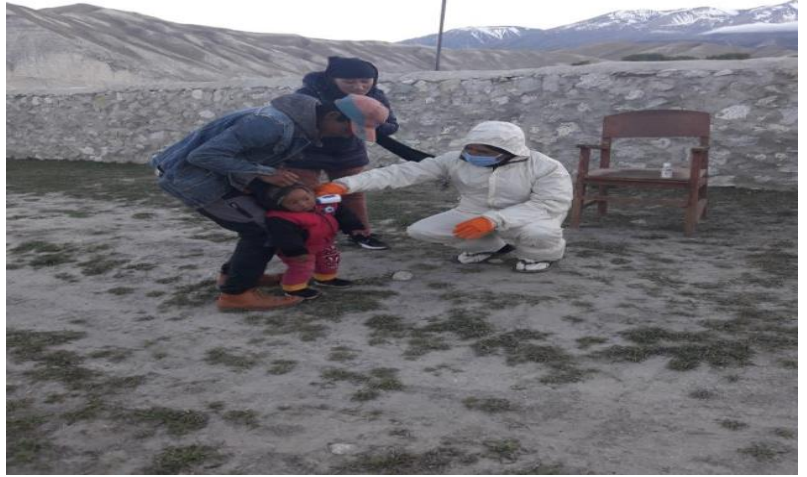
लोमान्थाङ गाउँपालिकामा स्थानियको फिभर चेक गर्दै स्वास्थ्यकर्मी ।

मिति २०७७/०२/०१ गतेसम्म मुस्ताङ जिल्लामा चारवटा हेल्थ डेस्क र जिल्ला अस्पतालमा स्थापना गरिएको फिभर क्लिनिकबाट १२,२७८ जनाको स्वास्थ्य परिक्षण गरिएको छ ।