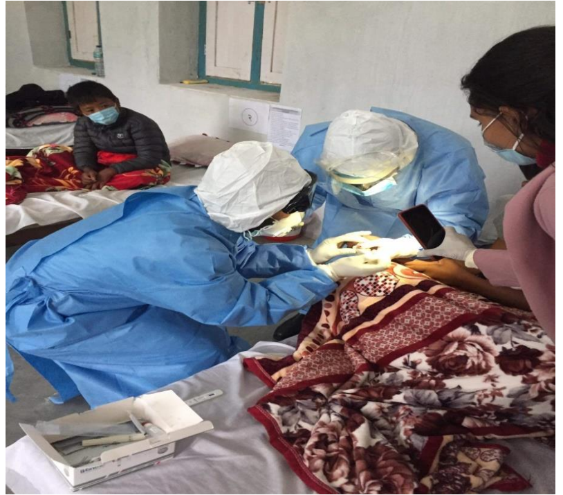
थासाङ गाउँपालिका स्थित क्वारेन्टाईन कक्षमा रहेका बिरामीहरुलाई RDT गर्दै जिल्ला अस्पतालका चिकित्सकहरु ।